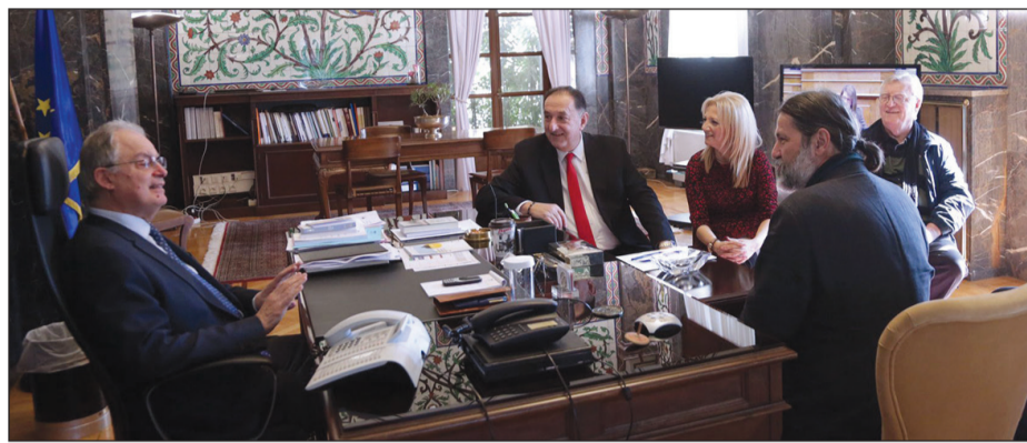
Στιγμιότυπο απ' τη συνάντηση στο γραφείο του προέδρου της Βουλής Κ. Τασούλα

Ο στόχος της ενωσιακής και εθνικής διάταξης είναι η διαφάνεια των εταιρικών δομών, η άμεση πρόσβαση των ελεγκτικών/διωκτικών αρχών σε αυτές και η αποτροπή κατάχρησης των εταιρικών δομών για σκοπούς ξεπλύματος χρήματος και χρηματοδότησης της τρομοκρατίας. Η ανάγκη για ακριβείς και επίκαιροποιημένες πληροφορίες σχετικά με τον πραγματικό δικαιούχο των επιχειρήσεων αποτελεί καθοριστικό παράγοντα για τον εντοπισμό των εγκληματιών, οι οποίοι θα μπορούσαν να αποκρύπτουν την ταυτότητά τους πίσω από μια εταιρική δομή.