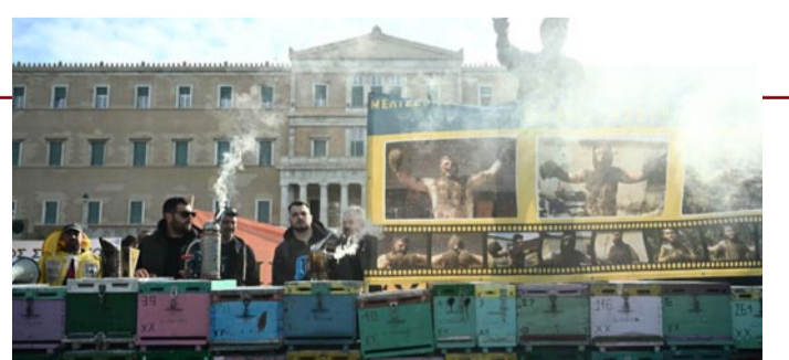
Κυψέλες έξω απ' τη Βουλή έστησαν οι μελισσοκόμοι από διάφορους νομούς στις 22 Φεβρουαρίου 2024. Οι μελισσοκόμοι διαμαρτυρήθηκαν για τα προβλήματα του κλάδου και ζήτησαν την προστασία του εισοδήματός τους.