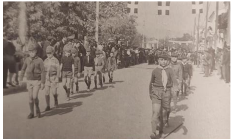
Παρέλαση των Λυκόπουλων. Ηγουμενίσσα 25 Μαρτίου 1966