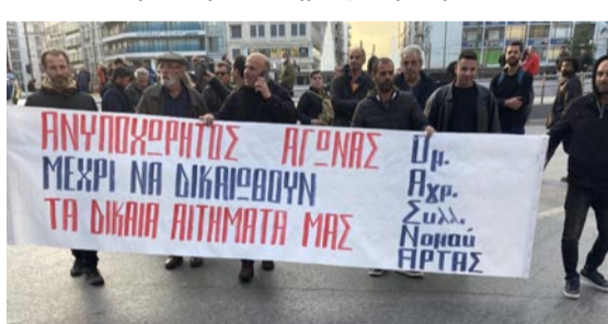
Η Ομοσπονδία Αγροτικών Συλλόγων Νομού Άρτας