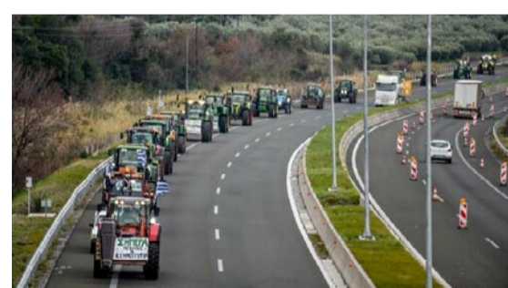
Κομβόι τρακτέρ στην εθνική οδό