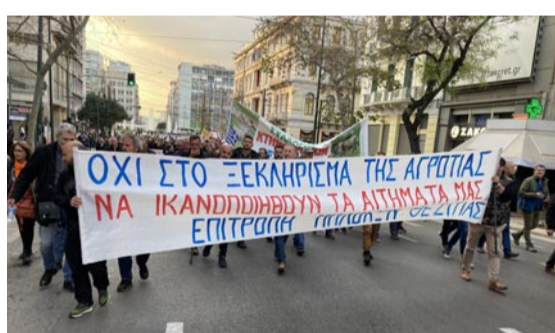
Η Επιτροπή Μπλόκων της Θεσπρωτίας