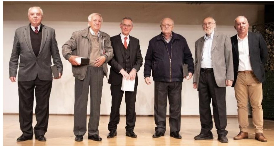
Μερικοί από τους τιμηθέντες

Η ίδρυση του Συλλόγου έγινε στη διάρκεια της δικτατορίας, όπου, όπως υπογράμμισε ο Άγγελος Πασπαλιούρου, «οι συλλογικές αυτές μορφές δράσης αντιμετωπιζόνταν από το καθεστώς με καχυποψία, πολλές φορές εχθρικά αλλά πάντως όχι φιλικά... Το κλίμα της εποχής, δηλαδή η έλλειψη ελεύθερης δράσης, και η επιβολή υποχρεωτικών κανόνων και ιδεολογιών, όπως "πατρίς - θρησκεία - οικογένεια", αποτυπώθηκαν στο πρώτο Καταστατικό του Συλλόγου. Π.χ. οι σκοποί της Αδελφότητας αναφέρονται γενικά και επιγραμμα-