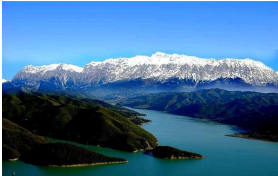
«Θα γίνει ένα "λαμπόγυαλο" το οποίο αλλοιώνει όλη την αισθητική του τοπίου και φυσικά και τα κλιματολογικά δεδομένα»