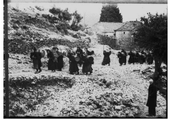
Ηπειρώτισσα Γυναίκα. Μοναδική η προσφορά της

στην καταπίεση των γυναικών είναι και πάλι ενάντια στους όρους και τις συνθήκες που τη δημιουργούν. Οι γυναίκες, δεν είναι γένους αλλά ήθους. Δεν είναι φύλο αλλά άνθρωπος.