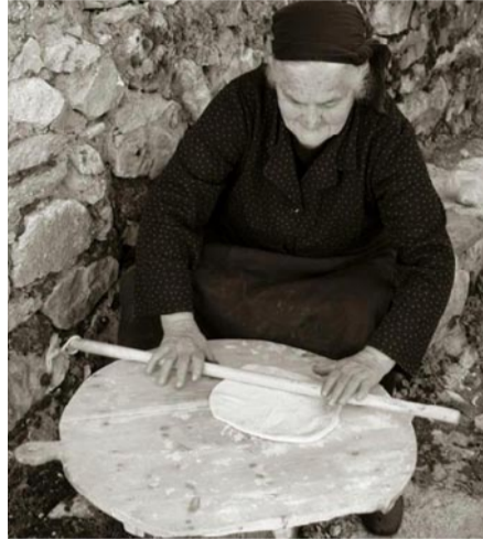
Ηπειρώτισσες Γυναίκες. Στη ράχη τους φορτώθηκαν πυρομα-

Ταυτόχρονα, σειρά αναχρονιστικών αντιλήψεων επιζούν και «ακμάζουν» και στη χώρα μας. Γυναίκες που εργάζονται νυχθημερόν, μέσα και έξω από το σπίτι, χωρίς να αναγνωρίζεται η προσφορά τους. Γυναίκες που έγιναν και είναι ακόμη τα θύματα της δημόσιας και ιδιωτικής βίας σε παγκόσμια κλίμακα. Η εκμετάλλευση και η κακοποίηση των γυναικών δεν είναι απλώς ένα λάθος του συστήματος. Είναι γέννημα της ίδιας της κοινωνίας, του κέρδους και του πλούτου. Από αυτήν την άποψη η πάλη ενάντια