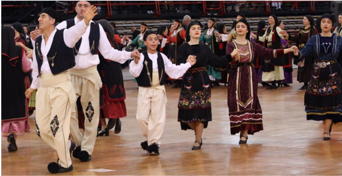
Γράφει ο Χρήστος Τούμπουρος, Έφορος Πολιτισμού της Π.Σ.Ε.

Ένας θεσμός, σαράντα ολόκληρα χρόνια, είναι πλέον ιερός και ακατάλυτος. Ό,τι και να γίνει, όπου κι αν γίνει, η «Πίτα του Ηπειρώτη», θα κυριαρχεί της ετήσιας δράσης της Πανηπειρωτικής Συνομοσπονδίας Ελλάδας (Π.Σ.Ε.). Τυχόν υπερβασική προσπάθεια κατάλυσης ή κατάργησης του θεσμού αυτού, αγγίζει επακριβώς τα όρια της ανομίας και της ασέβειας. Μπορούν να γίνουν πολλά άλλα, παράλληλα, εξίσου σημαντικά και να χαράξουν τη θετική πορεία τους μέσα στο χρόνο, την ιστορία της Πανηπειρωτικής Σ.Ε., χωρίς να χαθεί η «Πίτα του Ηπειρώτη», που κατάφερε να αντέξει το πέρασμα του χρόνου, με τις αλλαγές, την διαφοροποίηση των αναγκών της αποδημίας, τον προσανατολισμό σε πράγματα πεζά, μα εξίσου αναγκαία.