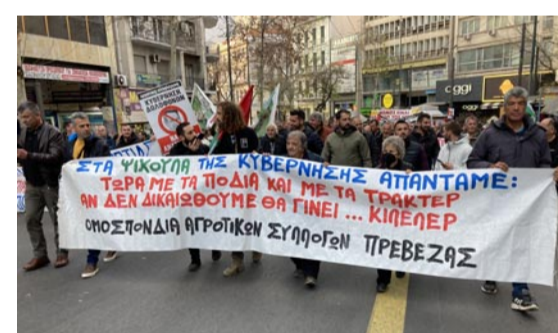
Η Ομοσπονδία Αγροτικών Συλλόγων Πρέβεζας