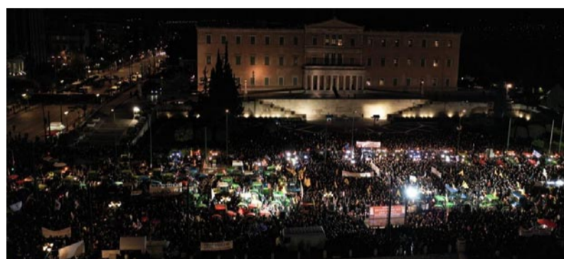
Η Βουλή περικυκλωμένη από αγρότες και τρακτέρ

Το συλλαλητήριο στο Σύνταγμα είχε προηγηθεί άκαρπη συνάντηση στο Μέγαρο Μαξίμου του πρωθυπουργού Κυριάκου Μητσοτάκη με αντιπροσωπεία της Πανελλαδικής Επιτροπής των Μπλόκων της