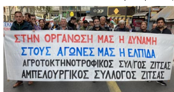
Οι Σύλλογοι Αγροτοκτηνοτρόφων και Αμπελουργών της Ζίτσας