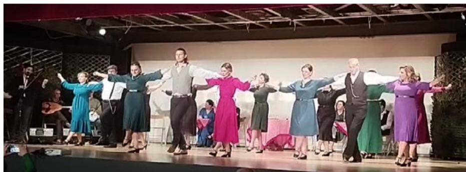
Το χορευτικό του Συλλόγου