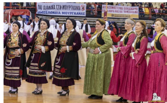
Το χορευτικό συγκρότημα της Ομοσπονδίας Μουργκάνας στη «Πίτα του Ηπειρώτη» στο Στάδιο Ειρήνης και Φιλίας (25.2.2024)

Μουργκάνας Άλκη Αλκαίο και Μιχάλη Γκανά.