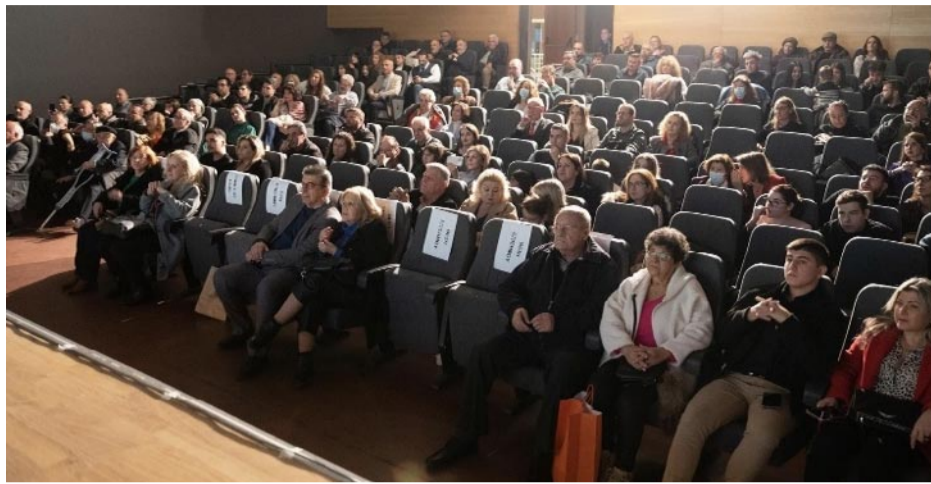
Γενική άποψη της εκδήλωσης

Τον Μάιο του 1973 ιδρύθηκε η «Αδελφότητα των εκ Πέτα Άρτης "Ο Άγιος Γεώργιος"». Και το βράδι της 9ης Δεκεμβρίου 2023, στο Δημοτικό Θέατρο της Καλλιθέας, η Βραδιά του Απόδημου Πετανίτη συνέπεσε με το ιωβηλαίο των πενήντα χρόνων απ' την ίδρυση της Αδελφότητας των «εκ Πέτα Άρτης» αποδήμων στο Λεκανοπέδιο Αττικής.