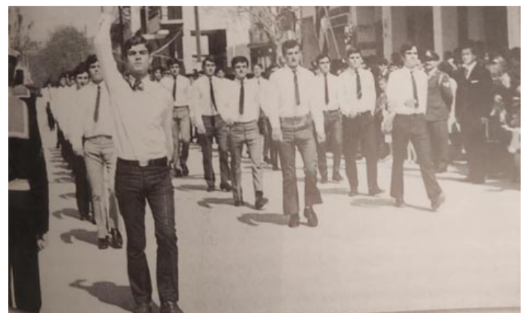
Παρέλαση Γυμνασίου Ηγουμενίσσας, 25 Μαρτίου 1971