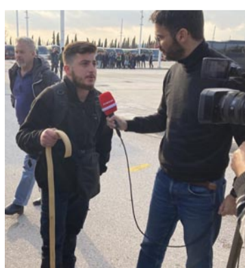
Δεν μας κρατάνε τα χωράφια χωρίς προστασία» έλεγε ο νεαρός αγρότης όταν έφτασε στο ΟΑΚΑ