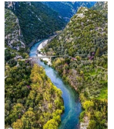
Ο Καλαμάς και γέφυρα που συνδέει την Οσδίνα με την Μπυλιάνη.