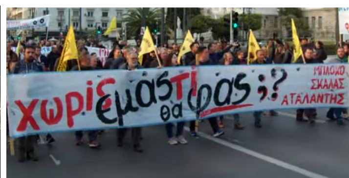
Το σύνθημα που έγινε διεθνές!

• Έργα υποδομής για την αντιπλημμυρική θωράκιση της χώρας.