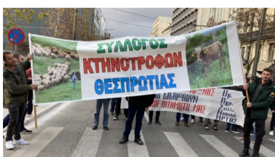
Νέοι κτηνοτρόφοι απ' τη Θεσπρωτία