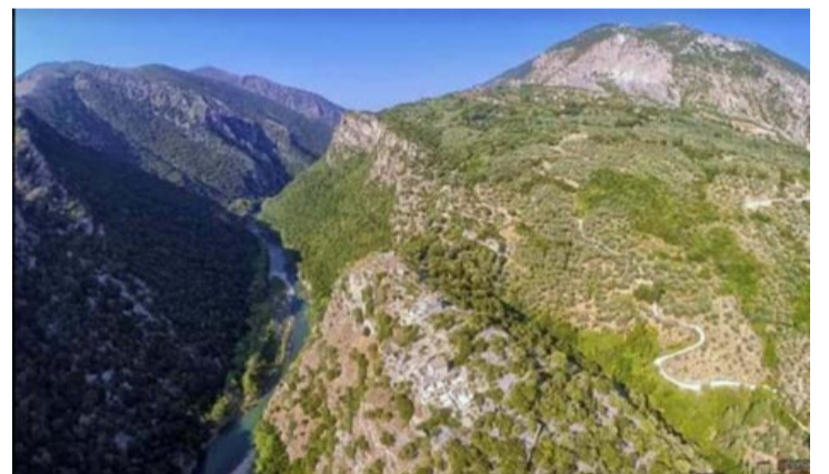
Καλαμάς, Οσδίνα (Παλιά και νέα-Πέντε Εκκλησιές), βουνό της Μίκλας

Στις αρχαιρεσίες που έγιναν την Κυριακή 21 Ιανουαρίου 2024 στην Αδελφότητα Ξενιτεμένων Πέντε Εκκλησιών Θεσπρωτίας, το Διοικητικό Συμβούλιο συγκροτήθηκε ως εξής: