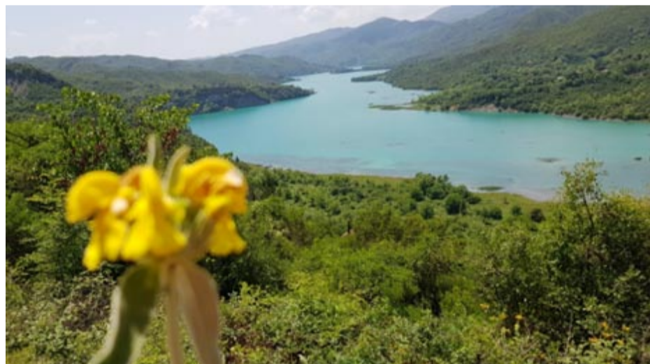
«Αφήστε αυτόν τον όμορφο κόσμο να διαιωνίζεται ανακυκλώνοντας το σύριο μες στις πηγές του» Νικηφόρος Βρεττάκος

φυσικά και τα κλιματολογικά δεδομένα. Και μιλάει για αποστάσεις λες και είναι στο πουθενά. Η Άρτα είναι 3,5χλμ. 1100 στρέμματα καθρέφτες επίπτωση τεράστια το καλοκαίρι. Ο ατμοσφαιρικός αέρας δεν είναι στάσιμος πάνω από την λίμνη. Μεταφέρεται.